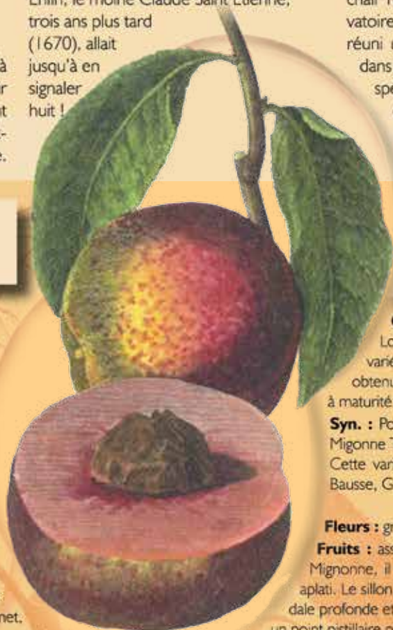
Vineuse de Fromentin

Leterme E. Les fruits retrouvés, France 1995